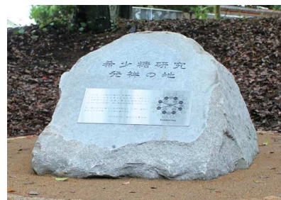
様々な機能性が発見され世界的に注目されている希少糖の研究は、香川大学農学部で発祥し、大きく進展しています。(写真は講内にある「希少糖研究発祥の地」記念碑)

食品の持つ人間に対する種々の生体調節機能などを化学的に理解し、①食品の機能性 ②安全性 ③嗜好性・加工特性について学びます。講義と実験・実習(学外の工場又は研究所見学なども含む。)を組み合わせ、基礎から応用、そして実践的内容のカリキュラムで、安全で、機能性が高く、様々な嗜好性に対応できる食品を開発できる人材の育成を行っています。